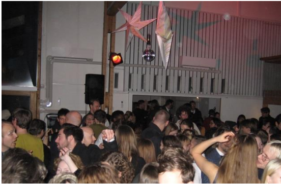
Julenachspiel i Salen

I 2022 kunne vi endelig avholde sommerfest og julenachspiel i Arkitektenes hus. Arkitekturprisen ble delt ut som del av sommerfesten, som ble en svært hyggelig kveld i salen. Julenachspillet ble en enda større suksess: køen ble fort lang og kvelden var enda ung da vi måtte stenge billettsalget. Her var det ratioen rømningsveier og deltakere som satt begrensingene!