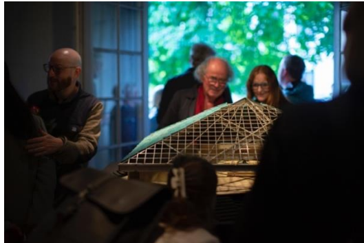
Bilder fra utstillingsåpning våren 2022