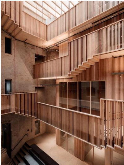
Pressens hus av KIMA og Atelier Oslo, Foto av Einar Aslaksen

Oslo Arkitektforenings Arkitekturpris gikk våren 2022 til Pressens hus; transformasjon tegnet av Kima arkitektur og Atelier Oslo.