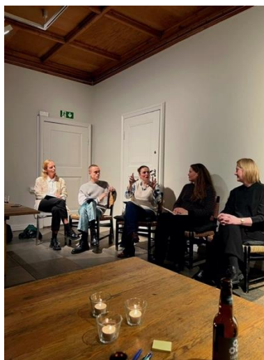
Bilder fra Fargeprat i Hagestuen med Atelier Particular, Line Musæus (a-lab) og Kine Angelo (NTNU). Samtalen etterpå ble ledet av Siri Jæger Brudvik, leder i OAF