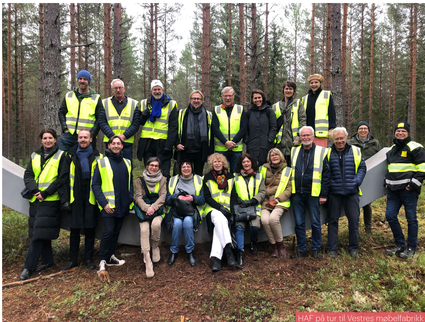
HAF på tur til Vestres møbelfabrikk

BIG-tegnede møbelfabrikk på Magnor og til Nord-Odal for å se biblioteket tegnet av Helen&Hard og et boligkompleks i Sagstual. Vi var 19 deltakere, og kjørte fra Lillehammer til Hamar og plukket alle på veien.