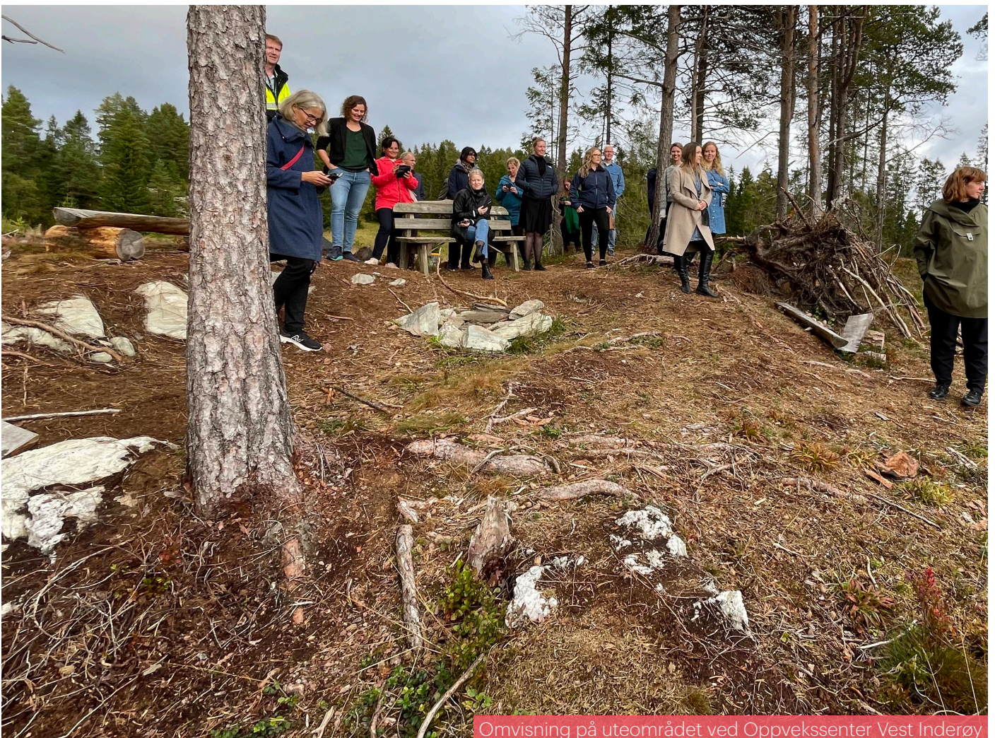
Omvisning på uteområdet ved Oppvekssenter Vest Inderøy

På høsten holdt vi også digitale medlemsmøter – Arkitektens lunsjprat. Et liten halvtimes møte, der hvert enkelt arkitektkontor har ordet og fritt velger tema, enten det er presentasjon av egne prosjekter eller å diskutere ulike fagtema. Dette har vært en aktivitet som NoTA-medlemmene har vært veldig positive til og en fin måte å holde kontakt med arkitektkollegaer på. Vi vil fortsette med dette utover neste semester.