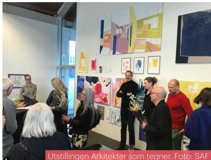
Utstillingen Arkitekter som tegner.

Diskusjonen rundt Akropolishøyden (med tilhørende bygninger for Rogaland teater, Stavanger museum og fylkeshuset) har gått for fullt gjennom året. SAF vil jobbe for å involvere seg mer i det videre arbeidet knyttet til utviklingen av denne viktige delen av Stavanger sentrum.