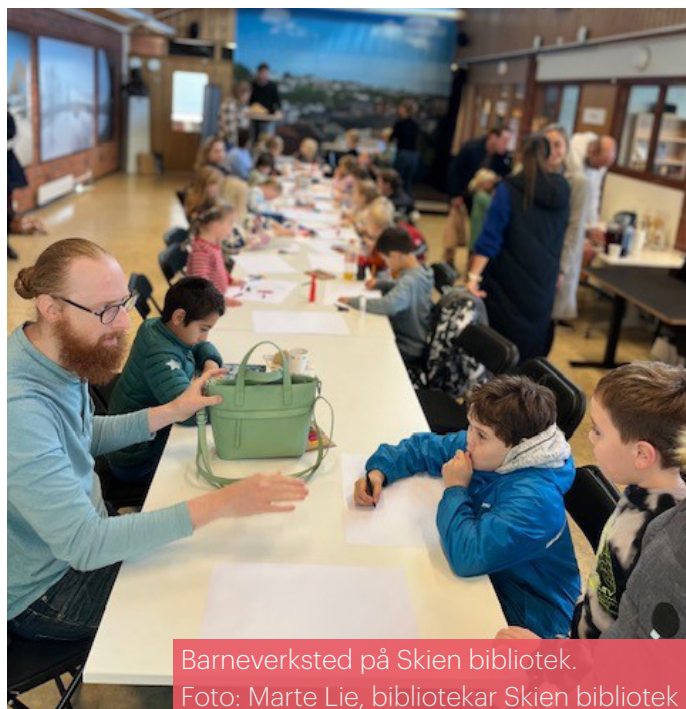
Barneverksted på Skien bibliotek.