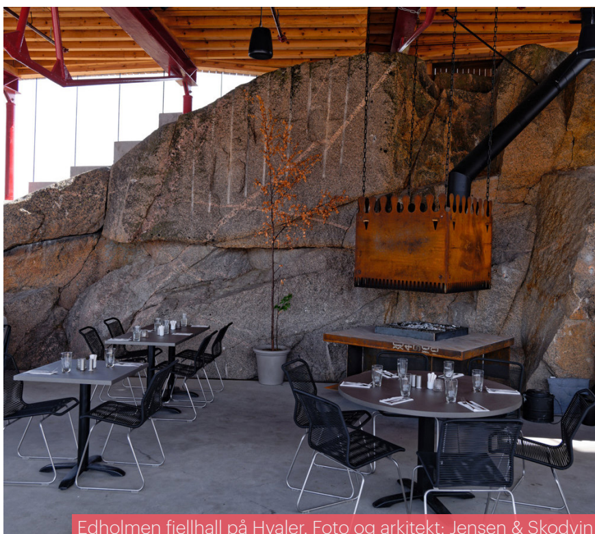
Edholmen fjellhall på Hvaler. Foto og arkitekt: Jensen & Skodvin

Vi ser en økende trend knyttet til tilflyttere til vår region, og styret vurderer å utrede en konkret strategi for rekruttering til NAL og ØAF.