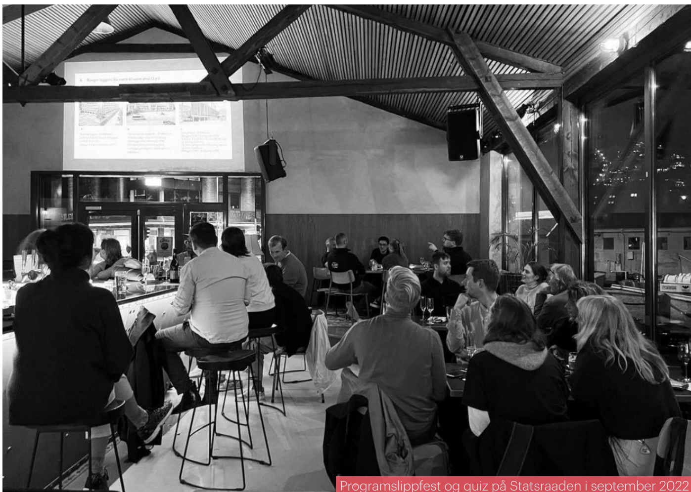
Programslippfest og quiz på Statsraaden i september 2022

Bærekraft: Fokus på arkitektur, miljø og klima.