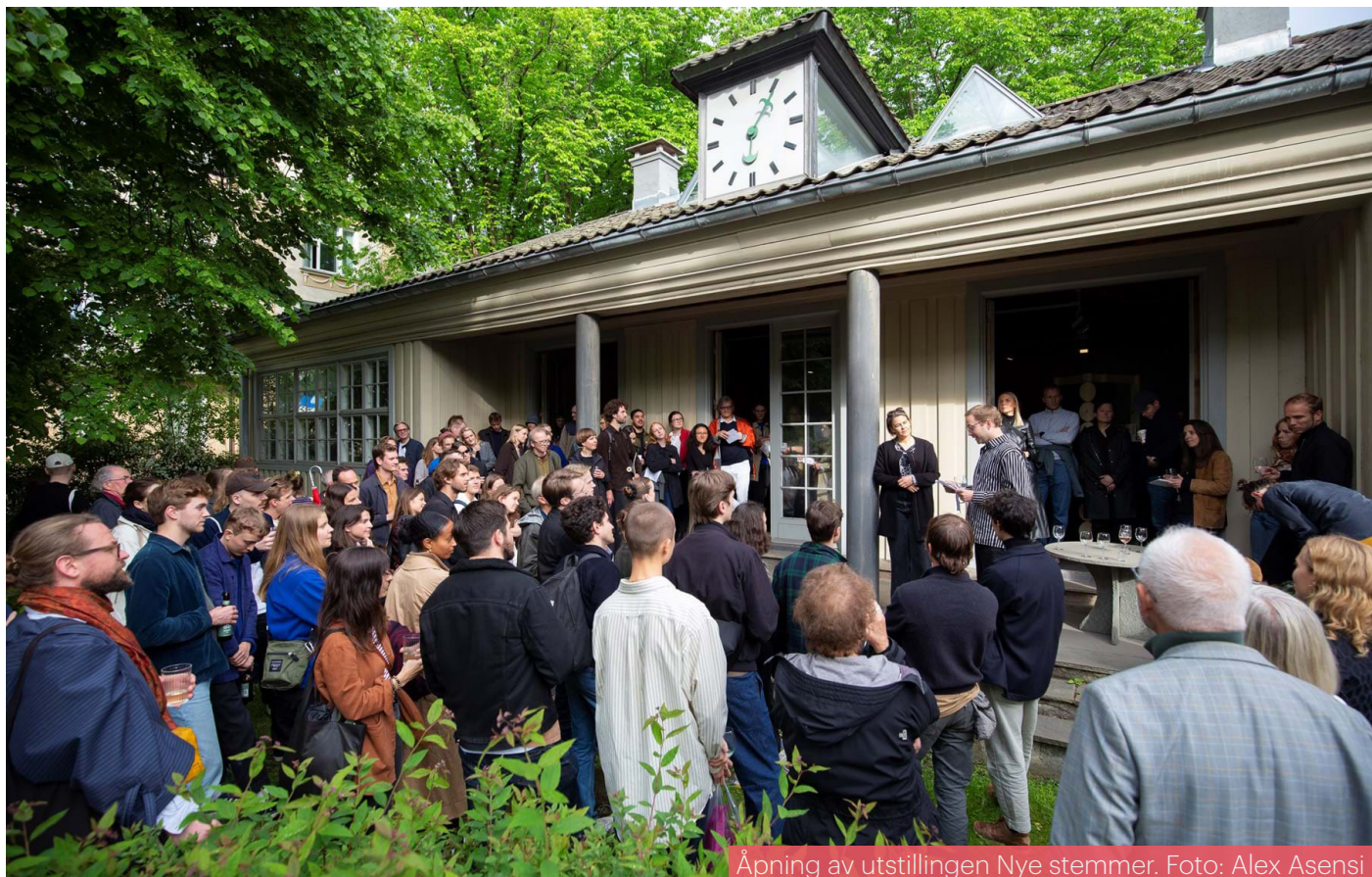
Åpning av utstillingen Nye stemmer.

NAL og OAF-leder hadde våren 2022 flere møter med MDG, Høyre, Arbeiderpartiet og SV i Oslo for å gi innspill til partiprogrammene i god tid før lokalvalget i 2023. Våre hovedpunkter var: Vi må bygge mindre nytt, vi må tenke flere funksjoner sammen, gjenbruk av materialer og bygg virker, men er vanskelig pga. regelverk og fordi det er kostbart.