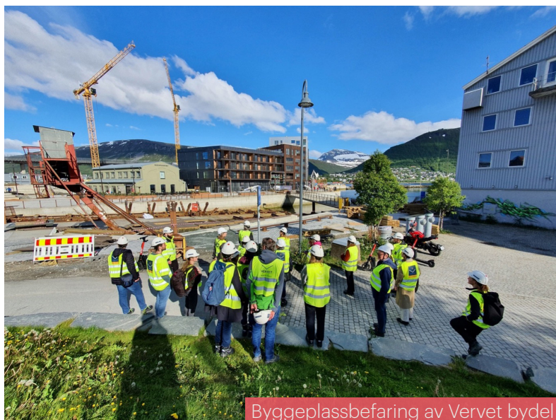
Byggeplassbefaring av Vervet bydel

Høsten 2022 begynte også arbeidet med utdeling av Nordnorsk arkitekturpris 2023, som vi håper å få utdelt i løpet av våren 2023. Fremover håper vi også å få arrangert digitale arrangementer hvor samtlige medlemmer kan delta på, også de som ikke befinner seg tett på byene.