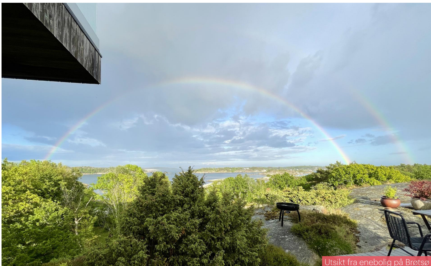
Utsikt fra enebolig på Brøtsø

VAF fortsetter kursen: flere gode foredrag, flere befaringer til prosjekter med en særlig miljøprofil og flere hyggelige møter med fagfeller. Vi har også en debattkveld i støpeskjeen med tema om byliv og utvikling i Vestfolds større byer; Holmestrand, Horten, Tønsberg, Sandefjord og Larvik.