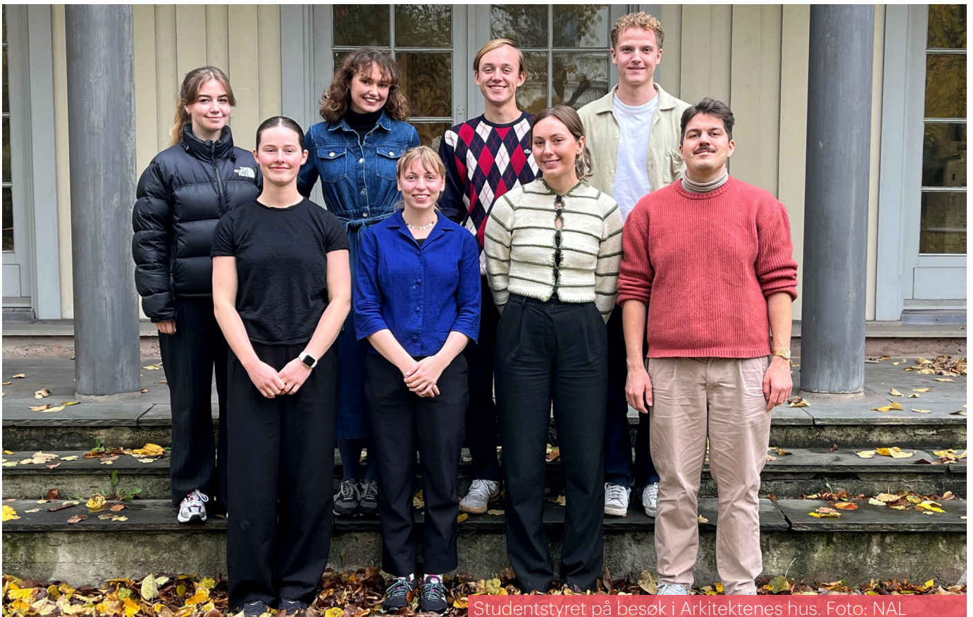
Studentstyret på besøk i Arkitektenes hus.

På skolene har det naturligvis vært stor glede rundt å kunne møtes uten begrensninger. Blant arrangementene i 2022 har vi NAL-lunsj, Vervevaffel, fargekurs, skrive- og retorikkurs, forskningskveld, kontorsafari, befaringer, servering av julebakst og julekampanje på sosiale medier. Vi har også hatt økt fokus på synlighet i form av visuelt materiale (plakater, bannere og merch) og stands. Gjengen i NAL student er klar for et nytt år med nye utfordringer og store ambisjoner!