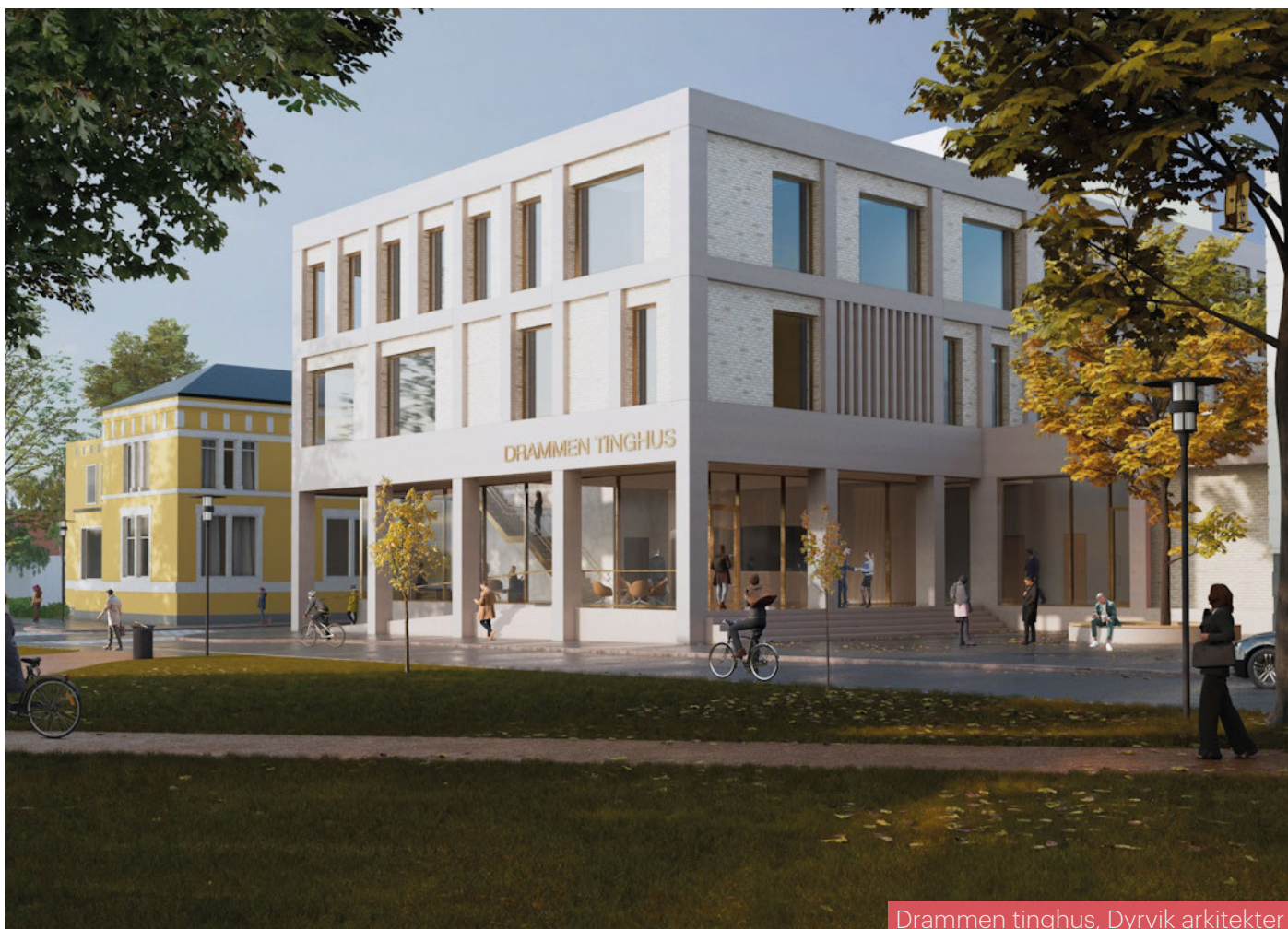
Drammen tinghus, Dyrvik arkitekter

Vi avsluttet DAF-året 8. desember med julemøte på Paviljongen mat & vinhus i Drammen.