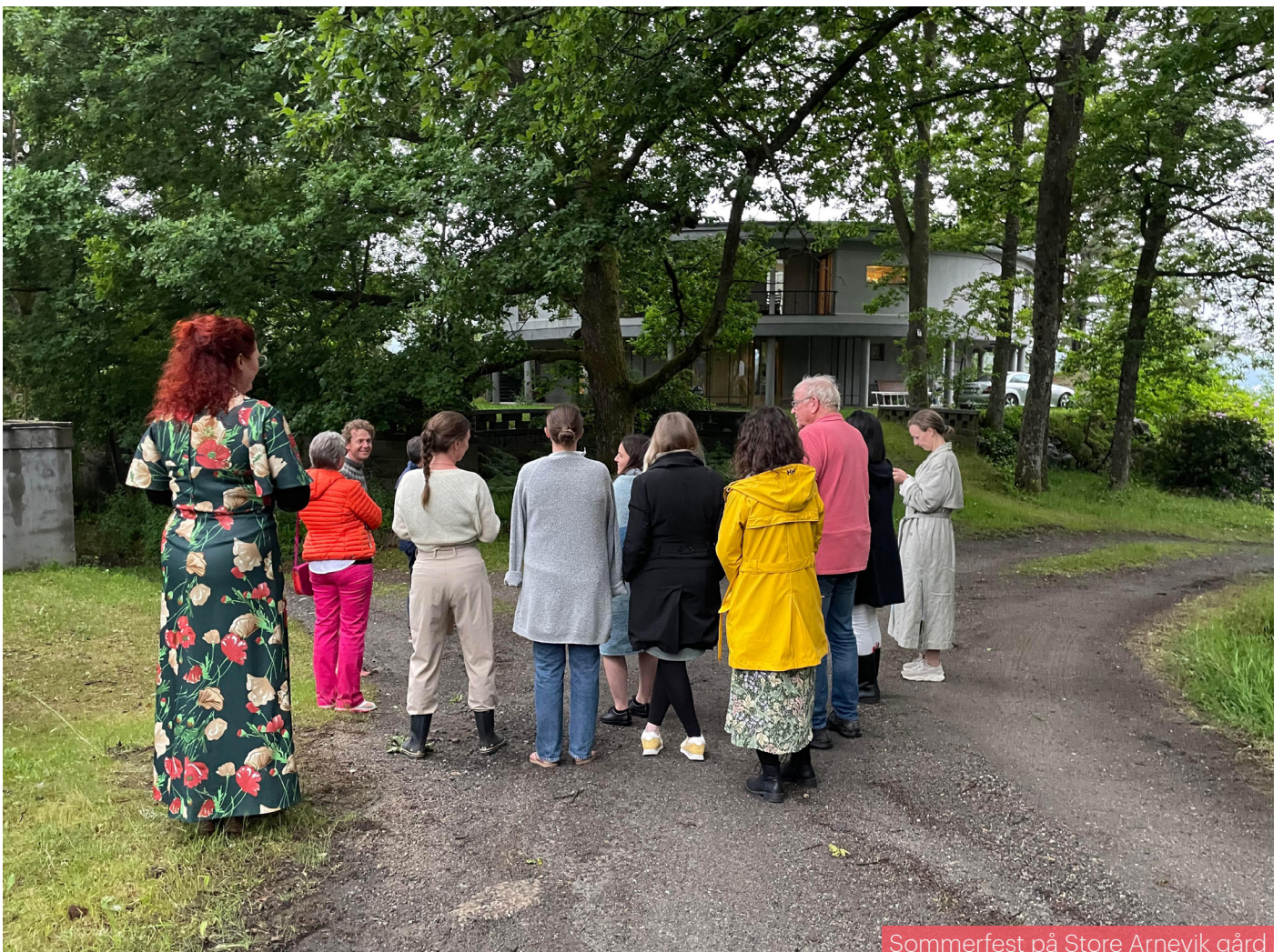
Sommerfest på Store Arnevik gård