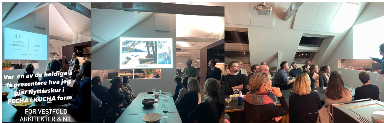
VAF Nyttårstur '24 + Pecha Kucha hos KB Arkitekter